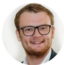
Martin Pister Thüga SmartService GmbH