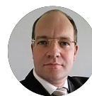
Jens Lück Bundesnetzagentur für Elektrizität, Gas, Telekommunikation, Post und Eisenbahnen